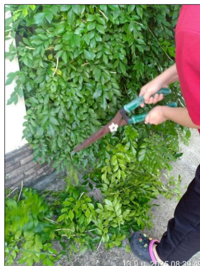
รูปภาพที่ 2.2 คนสวน