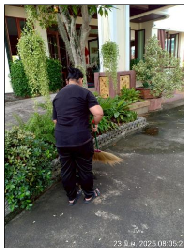
รูปภาพที่ 2.12 ทำความสะอาดพื้นที่โครงการ