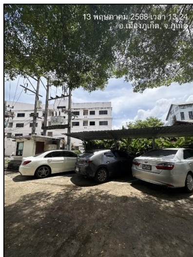
รูปภาพที่ 2.7 พื้นที่จอดรถ