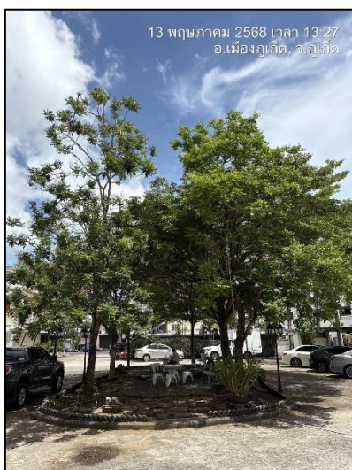
รูปภาพที่ 2.3 พื้นที่ของโครงการ