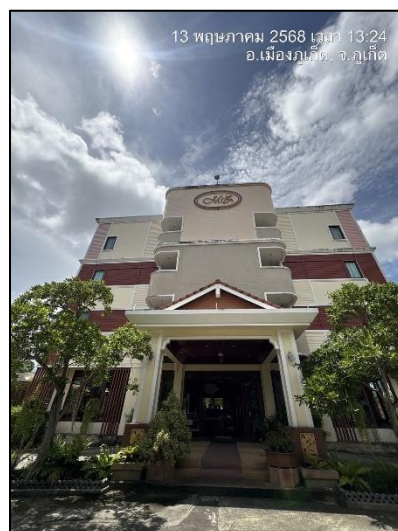
รูปภาพที่ 2.4 อาคารของโครงการ