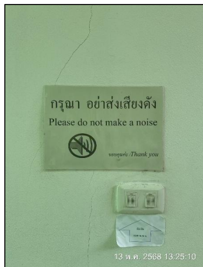
รูปภาพที่ 2.10 ป้ายกรุณาอย่าส่งเสียงดัง