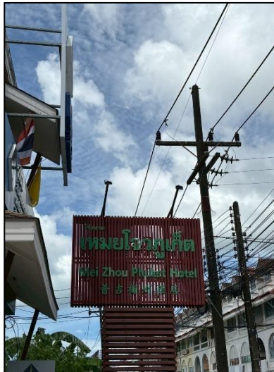
รูปภาพที่ 2.5 ป้ายโครงการ