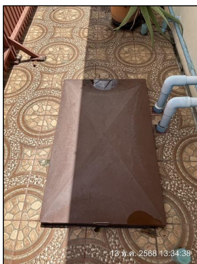
รูปภาพที่ 2.13 ถังเก็บน้ำ