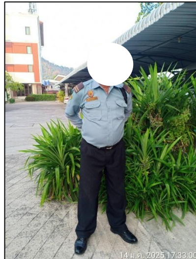
รูปภาพที่ 2.6 เจ้าหน้าที่รักษาความปลอดภัย