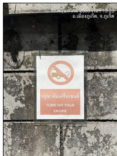
รูปภาพที่ 2.9 ป้ายกรุณาดับเครื่องยนต์