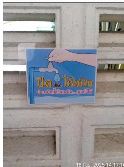
รูปภาพที่ 2.14 ป้ายรณรงค์และประชาสัมพันธ์ให้ประหยัดน้ำ