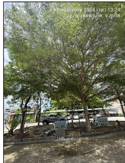
รูปภาพที่ 2.1 พื้นที่สีเขียว