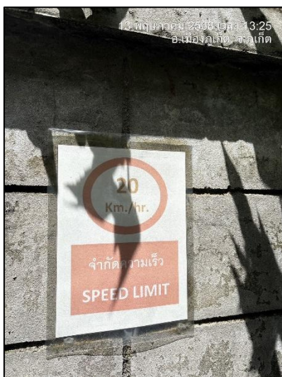
รูปภาพที่ 2.8 ป้ายจำกัดความเร็วไม่เกิน 20 กม./ชม.